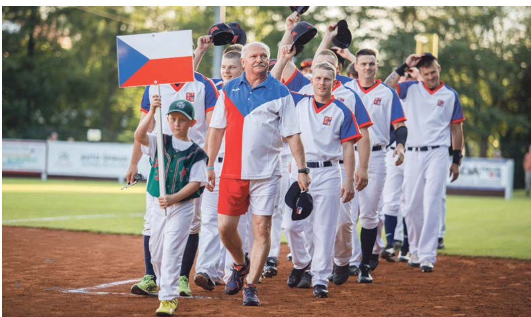
Havlíčkův Brod má s velkými softbalovými akcemi zkušenosti. V letech 2010 a 2014 hostil evropské šampionáty.

Světový šampionát 2019 se kromě Havlíčkova Brodu bude hrát také v Praze. A bude to velká premiéra – Česko ani žádná jiná evropská země totiž ještě nikdy mistrovství světa v softbalu nehostilo. Program ani formát turnaje zatím není znám, organizátoři se ho ale podle svých slov budou snažit sestavit tak, aby se v Brodě