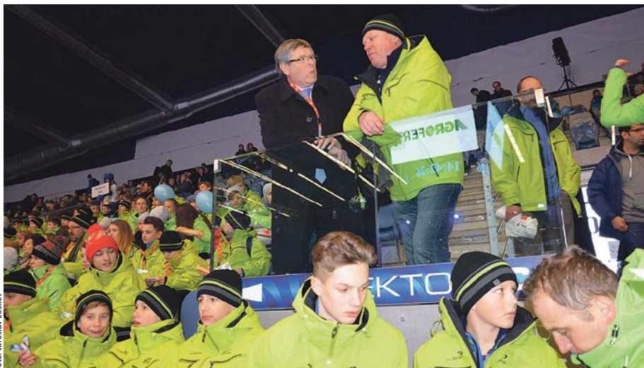
Setkání hejtmana Kraje Vysočina se sportovci přímo na stadionu v Chomutově. Největší naděje jsou vkládány do rychlobruslařů a reprezentace v alpských disciplínách a biatlonu.