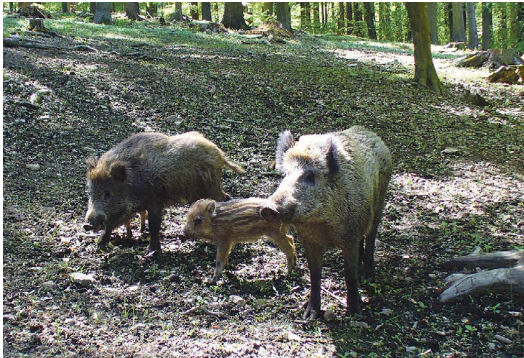
Počty černé zvěře na Vysočině od roku 2010 stoupaly, redukcí jejich stavu v poslední době řeší Kraj Vysočina platbami myslivcům za čelisti mladých kanců a bachyní.