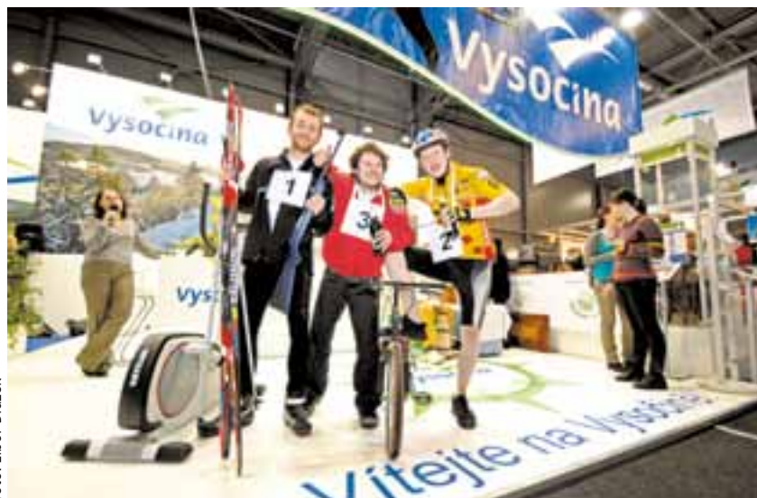
Letošní Regiontour byl ve znamení lyží a lyžování, které mají na Vysočině, především na Novoměstsku, více než stoletou tradici.