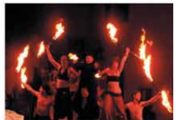
Novusorigo UV a Light Show