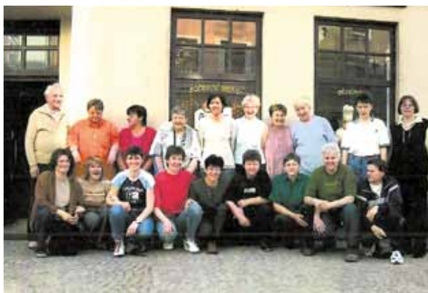
Poslední sraz hráček a trenérů v Jihlavě na počátku nového tisíciletí.