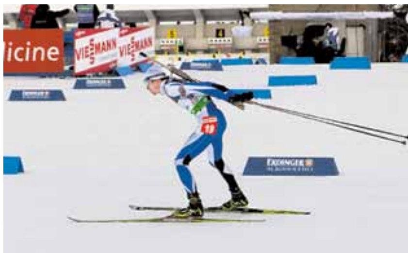
Světový pohár v biatlonu přilákal k tratím v Novém Městě na Moravě několik desítek tisíc diváků. Nedělní stíhací závody sledovalo rekordních 18 tisíc návštěvníků.

Po jedenatřiceti letech se do České republiky vrátila světová biatlonová elita. Areál v Novém Městě na Moravě hostil od 11. do 15. ledna celkem šest závodů pátého kola Světového poháru v biatlonu, k jehož pořádání výrazně přispěl i Kraj Vysočina.