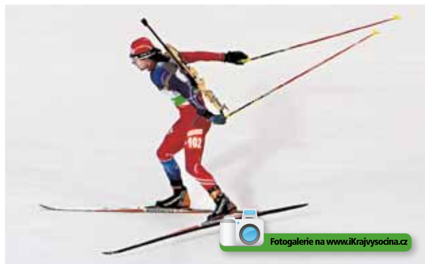
Organizátoři v Novém Městě na Moravě nenechali nic náhodě a pro závodníky připravili skvělé tratě srovnatelné s ostatními světovými středisky.

Ve čtvrtek byl na programu vytrvalostní závod mužů, kde byl největší českou nadějí Michal Šlesinger. Před domácím publikem ale úplně propadl, po pádu v prvním kole a sedmi chybách na střelnici nakonec projel cílem až na 75. místě. Českou jedničku nakonec zastoupil Jaroslav Soukup na 14. místě, lépe skončil i 20. Moravec, 53. Vítek a 64. Holubec.