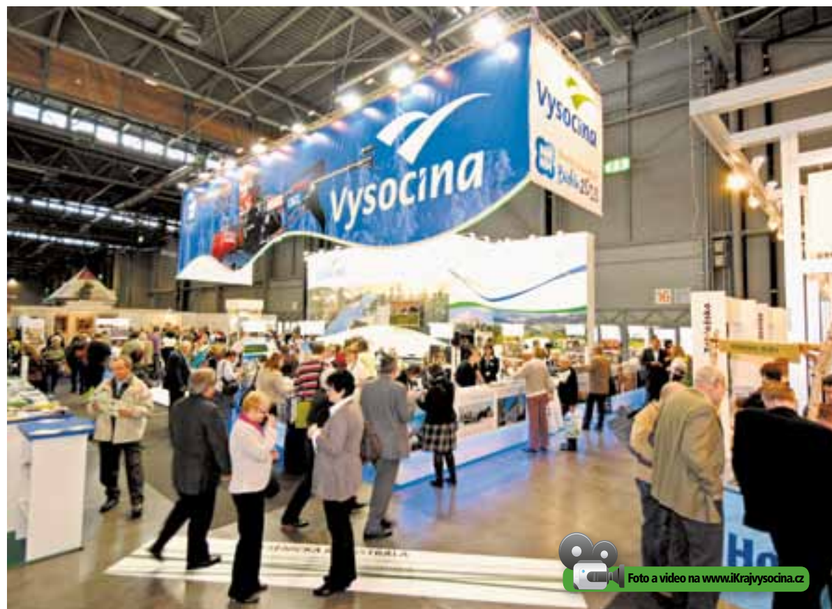
Stánek Kraje Vysočina se proměnil v část biatlonové tratě, návštěvníci mohli vyzkoušet tréninkové biatlonové střílnice a běžecký trenážer.

Představení Vysočiny na Regiontouru v Brně přitom svou koncepci kopirovalo Světový pohár v biatlonu, jednu z největších sportovních událostí České republiky roku 2012, který se ve stejnou dobu konal v Novém Městě na Moravě. Kromě tréninkové biatlonové střílnice si zájemci mohli vyzkoušet i běžecký trenážer, na vlastní kůži prožít hromadný biatlonový start nebo si odžít jedinečnou atmosféru cílové rovinky, i když v trochu netradičním scénickém podání.