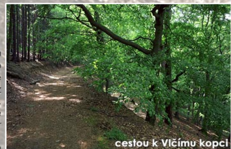
cestou k Vlčímu kopci