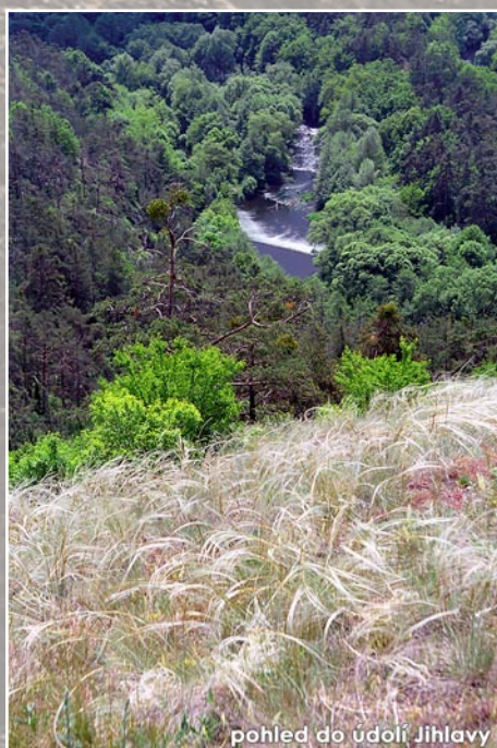
pohled do údolí Jihlavy

Kolem unikátní přírodní lokality - Mohelenské hadcové stepi - do údolí Oslavy. Z Vlčího kopce Haugwitzovou alejí k rozhledně Babylon.