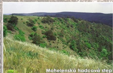
Mohelenská hadcová step

Rozhledna Babylon, pravidelně je otevřena v neděli odpoledne, v ostatní dny je možné ji navštívit po dohodě s Obecním úřadem Kramolín (tel. 568 645 206, e-mail: obec.kramolin@quick.cz ).