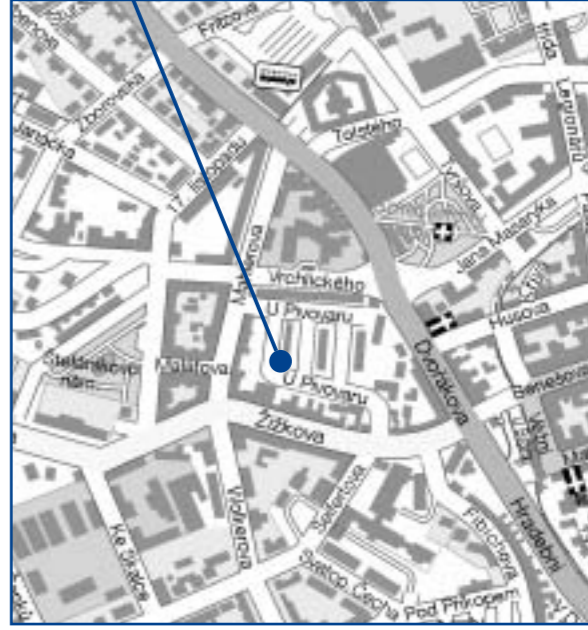
■ Jihlava – hlavní přístupové trasy