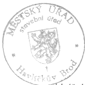
Bohumil Veselý referent stavebního úřadu

Rozhodnutí má podle § 93 odst. 1 stavebního zákona platnost 2 roky. Podmínky rozhodnutí o změně stavby platí po dobu trvání změněné stavby, nedošlo-li z povahy věci k jejich konzumaci.