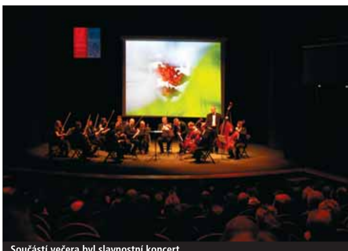
Součástí večera byl slavnostní koncert.