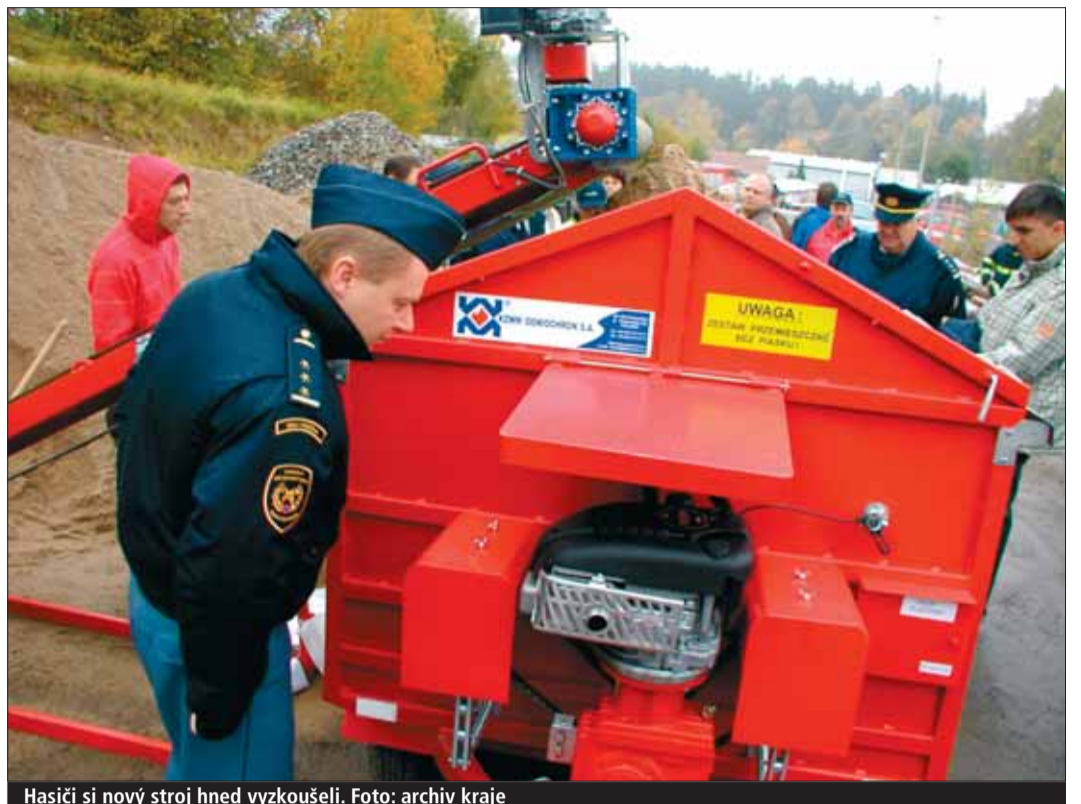
Hasiči si nový stroj hned vyzkoušeli.

„V posledních letech dochází nejen na Vysočině k nárůstu četnosti a intenzity povodní, které na území kraje působí značné majetkové a další škody a nemalou měrou zatěžují rozpočty obcí, potažmo kraje. Mezi ohrožená místa patří lokality, ve kterých dosud nejsou vybudována protipovodňová opatření, případně i taková místa, kde hrozí, že vlivem nepříznivých podmínek povodeň tato protipovodňová opatření překoná nebo lokality, ve kterých není možné stále protipovodňové opatření zbudovat. Osvědčeným způsobem ochrany před povodněmi jsou hráze z pytlů s pískem. Rychlost stavění hrází je však omezena počtem lidí, kteří pytle plní.