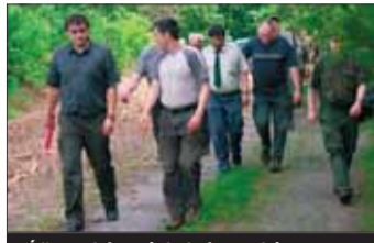
Účastníci setkání si nové lesy prohlédli.

Vlkov (jb, kid) • Na Vysočině přibývá lesů. Zaznělo to na tradičním setkání lesníků Vysočiny, tentokrát na téma zalesňování zemědělské půdy na Žďársku.