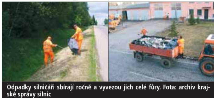
Odpadky silničáři sbírají ročně a vyvevou jich celé fúry.

„Sběr odpadků u komunikací je práce časově i finančně velice náročná. Nejen, že se nám snižují pracovní kapacity, ale peníze použité na úklid podél silnic by mohly být využity efektivněji například na zlepšení kvality silnic. Během úklidových prací se našim zaměstnancům podaří vysbírat řádově tisíce kilogramů odpadků,