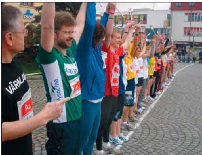
Start štafety přátelství, kterou si symbolicky vystříhli i hejtman Miloš Vystrčil a žďárský starosta Jaromír Brychtou.