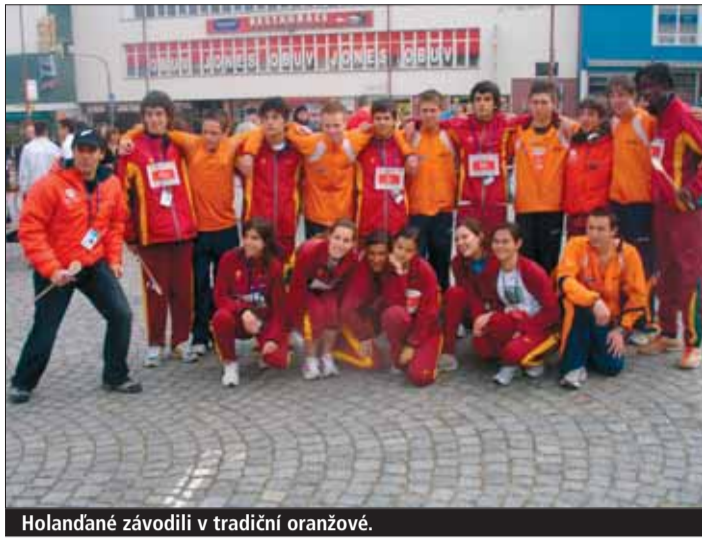
Hollandané závodili v tradiční oranžové.