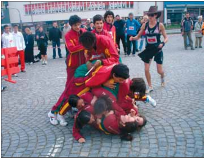
Mladí Portugalci uspořádali na žďárském náměstí i valnou hromadu.