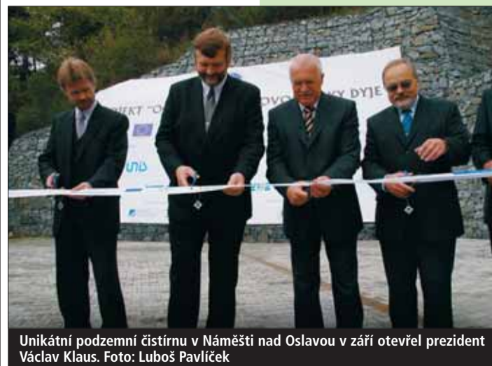
Unikátní podzemní čistírnu v Náměšti nad Oslavou v září otevřel prezident Václav Klaus.

procent přítom zaplatila Evropská unie a pět procent Státní fond životního prostředí. Celkem bylo opraveno, nebo postaveno 102 kilometrů kanalizace, zrekonstruováno sedm čistírek a jedna postavena zbrusu nová.