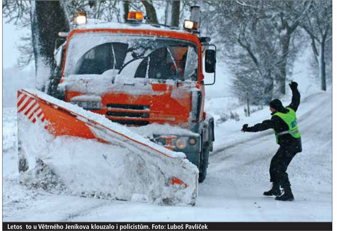
Letos to u Větrného Jeníkova klouzalo i policistům.