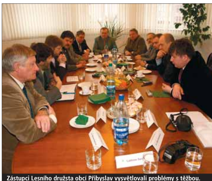
Zástupci Lesního družstva obcí Přibyslav vysvětlovali problémy s těžbou.