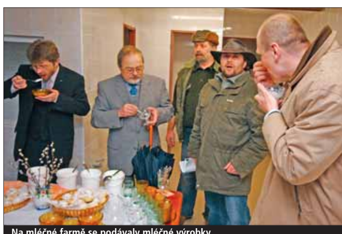
Na mléčné farmě se podávaly mléčné výrobky....