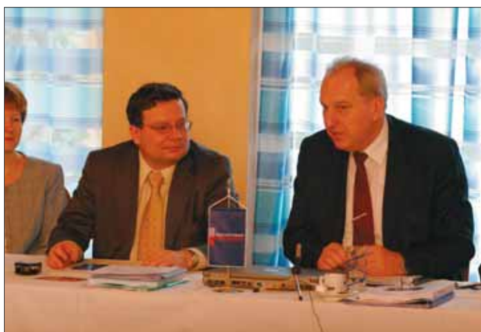
O českém předsednictví EU mluvil s hejtmany vicepremiér Alexandr Vondra (vlevo).