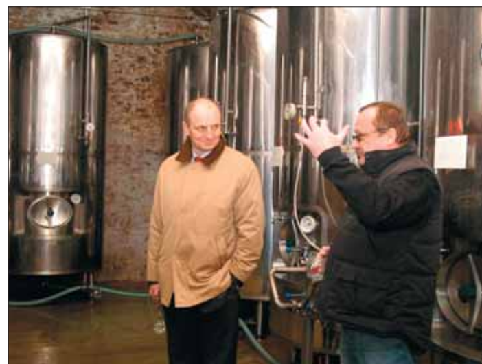
Malý hrabalovský pivovar v Dalešicích je kulturním centrem jihovýchodní části kraje.