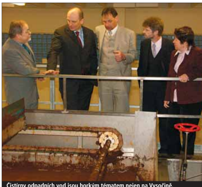
Čistírny odpadních vod jsou horkým tématem nejen na Vysočině.