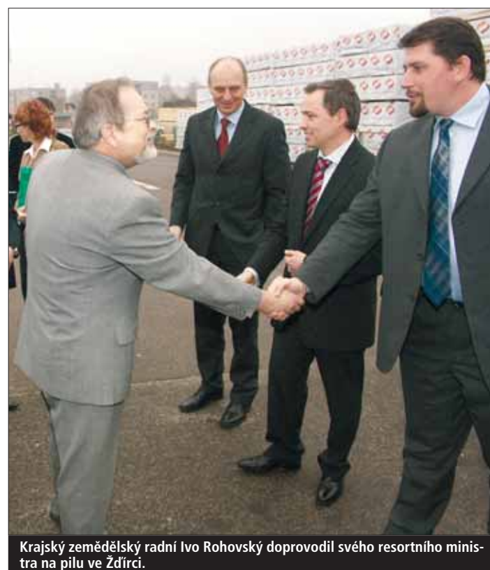
Krajský zemědělský radní Ivo Rohovský doprovodil svého resortního ministra na pilu ve Žďárci.