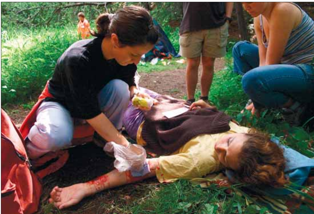
Výuka první pomoci je velmi názorná.

Vysočina (hat, kid) • Do krajského projektu První pomoc do škol se letos nově zapojí 1897 žáků 17 středních škol a učilišť. Výuka první pomoci pro středoškolačky bude mít tři vyučovací hodiny a povedou ji odborníci z krajské záchranné služby.