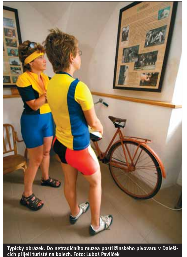
Typický obrázek. Do netradičního muzea postřížinského pivovaru v Dalešicích přijeli turisté na kolech.

Turisté se o našem kraji nejvíce dozvídají z internetu (přes 60 procent), kombinují jej s propa-