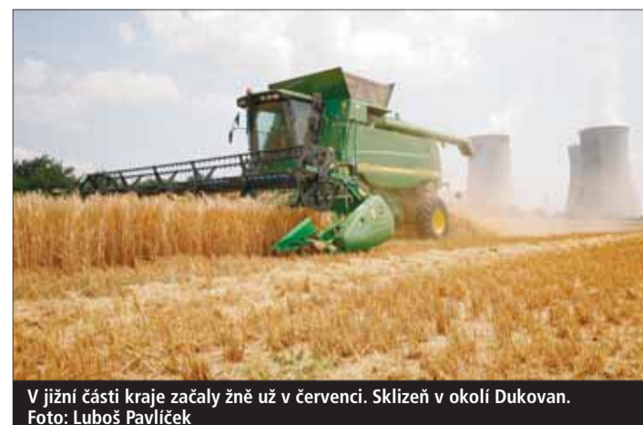
V jižní části kraje začaly žně už v červenci. Sklizeň v okolí Dukovan.

Zemědělci teď mohou pouze sčítat ztráty. Neskldí ani polovinu toho, s čím počítali a navíc v téměř neprodejné kvalitě. Kvůli do- suhování, zvýšeným cenám nafty a elektřiny a dalším nákladům musí do sklizně investovat daleko větší peníze. Pokud chtějí obilí využít alespoň ke krmení, musí je chemicky ošetřit a to zname-