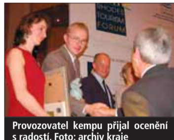
Provozovatel kempu přijal ocenění s radostí.

kladnými a jednoduchými způsoby. Cenu udělila nadace The Royal Awards for Sustainability během kongresu Rhodes Tourism Forum v Řecku. Vítězové z rukou představitelů vlády pořadatelské země získali také sošku Oikos, která představuje na jedné straně dopady cestovního ruchu na naši planetu a na druhé straně naději a úsilí lidí najít řešení těchto problémů.