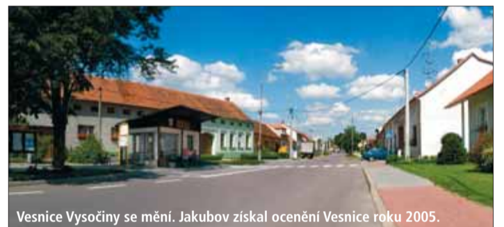
Vesnice Vysočiny se mění. Jakubov získal ocenění Vesnice roku 2005.

Třetí skupina dotací pouze protéká přes účty kraje a do rozpočtu není zahrnuta, např. dotace na sociální dávky vyplácené obcemi, na lážka v domovech důchodců a ústavech sociální péče, na výkon státní správy obcí.