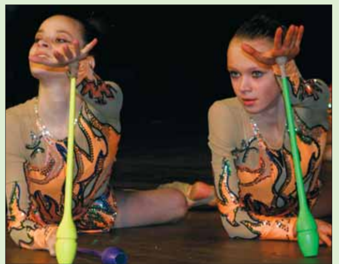
Program večera zpestřilo vystoupení trebičských gymnastek.