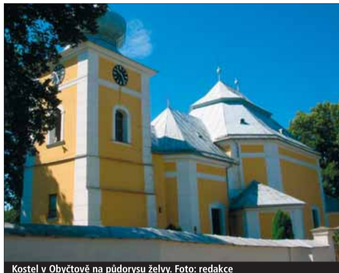
Kostel v Obyčtově na půdorysu želvy.

Cesta na Zelenou horu začíná hned vedle zámku a prohlídka kostela už turistovi neklade žádné překážky, průvodce je profes-