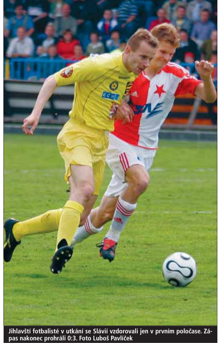
Jihlavští fotbalisté v utkání se Slavií vzdorovali jen v prvním poločase. Zápas nakonec prohráli 0:3.

Jihlavské vedení nemá přesně stanovené datum, kdy chce vidět svoje mužstvo zase zpět v první lize. V jednom má jasno: klub chce prý dál budovat na zdravých základech. Pro Vysočinu je nyní prioritou dostavba a rekonstrukce stadionu v Jiráskově ulici. Dál chce také stavět svůj tým na současných pilířích a k tomu dávat stále víc šancí talentovaným mladíkům, na jejichž růst se dohlíží ve specializovaných sportovních třídách.