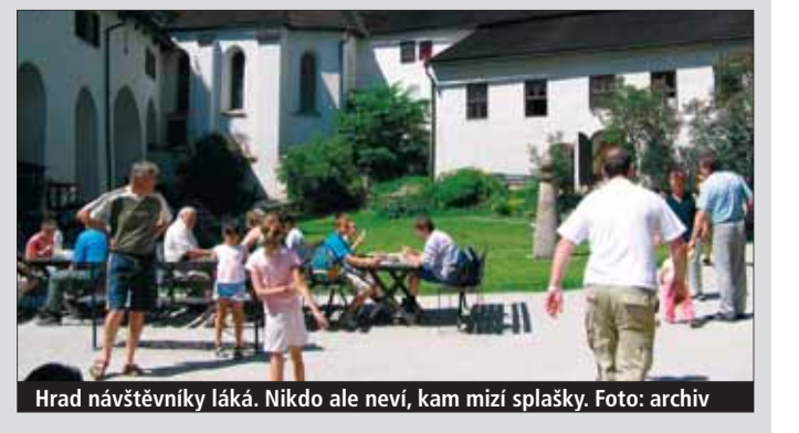
Hrad návštěvníky láká. Nikdo ale neví, kam mizí splašky.