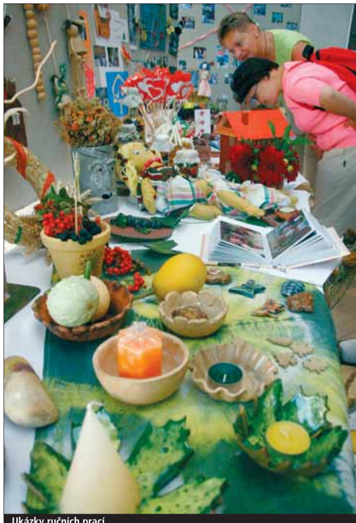
Ukázky ručních prací.