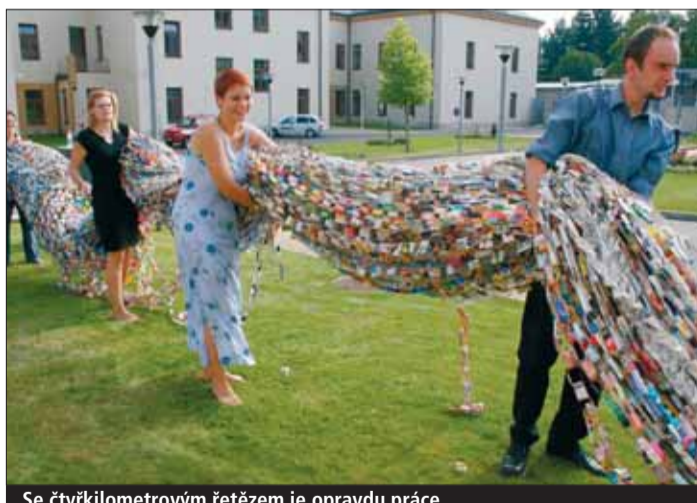
Se čtyřkilometrovým řetězem je opravdu práce.