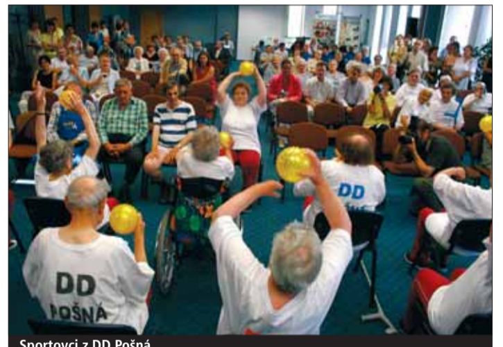
Sportovci z DD Pošná.