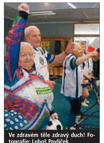
Ve zdravém těle zdravý duch!

Jihlava • Divadlo, hudba, ukázky ručních prací a čtyři kilometry dlouhý pápiový řetěz. I tak vypadalo už druhé setkání domovů důchodců a ústavů sociální péče v sídle kraje. Akci s názvem Srdce na dlani II zařadil radní pro sociální věci Jiří Vondráček (KDU-ČSL).