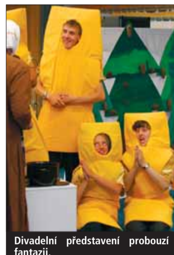
Divadelní představení probouzí fantazii.