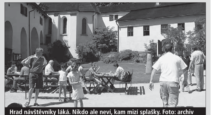
Hrad návštěvníky láká. Nikdo ale neví, kam mizí splašky.

Doupě • Hrad Roštejn na Jihlavsku, který je pod přímou správou kraje, dostane novou čistírnu odpadních vod. Krajská rada schválila zadání projektu na domácí čistírnu s tím, že stavba by měla proběhnout už příští rok. Hradem ročně projde více než 30.000 návštěvníků.