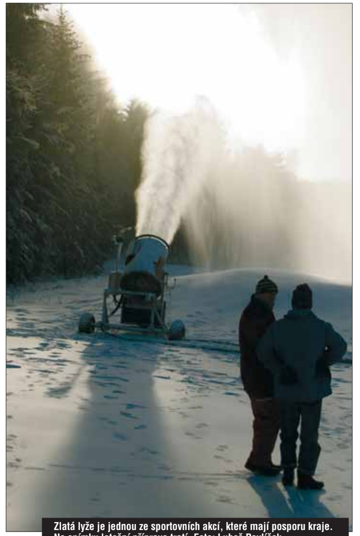
Zlatá lyže je jednou ze sportovních akcí, které mají posporu kraje. Na snímku letošní příprava tratí.