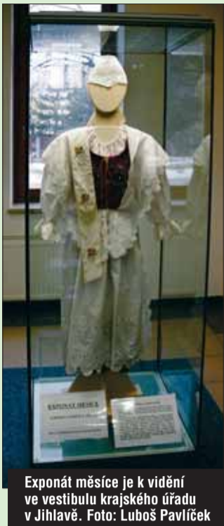
Exponát měsíce je k vidění ve vestibulu krajského úřadu v Jihlavě.