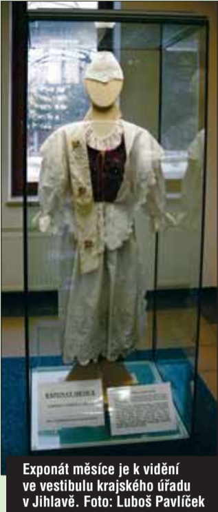
Exponát měsíce je k vidění ve vestibulu krajského úřadu v Jihlavě.