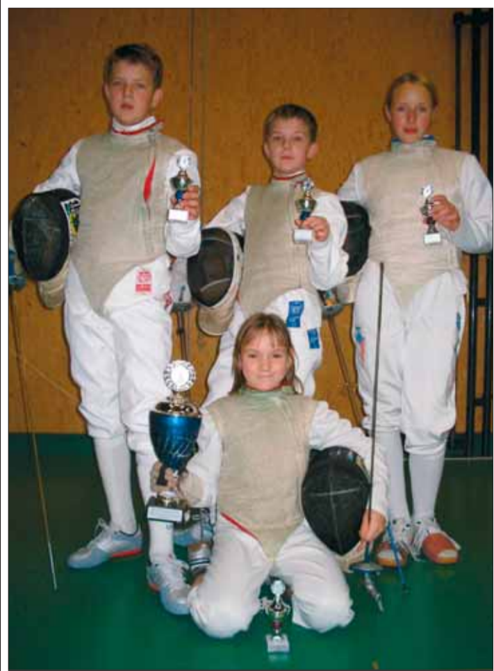
Úspěšní bystřičtí šermíři jsou na své trofeje patřičně hrdí.

České rychlobruslařské úspěchy se rodí doslova na kolenech a ve velice skromných podmínkách. První výraznější popud dal v roce 1988 na olympijských hrách v Calgary svratecký Jiří Kyncl, který se pod vedením trenéra Nováka probojoval mezi nejlepšími šestnáctku.