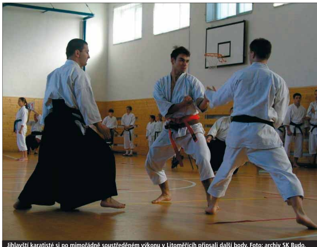
Jihlavští karatisté si po mimořádně soustředěném výkonu v Litoměřicích připsali další body.

Národní pohár je vícekolová soutěž, při níž karatisté sbírají body za umístění. Nejlepších osm podle součtu bodů se po skončení poháru nominuje na mistrovství republiky. Příští kolo Národního poháru se koná na jaře 2006.