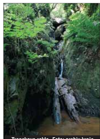
Trenckova rokle.