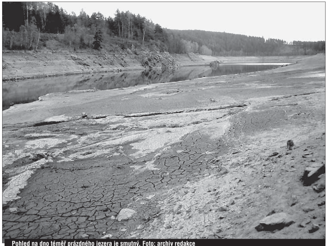
Pohled na dno téměř prázdného jezera je smutný.

Sypaná hráz mostišťské přehrady má narušené jílové jádro. Porucha má příčinu zejména v nekvalitní stavbě ze šedesátých let minulého století. Z bezpečnostních důvodů je dnes přehrada upuštěná a opravy mají být dokončeny do začátku zimy. Problém řeší kraj velmi razantně, ustanovil pracovní skupinu, která se schází pravidelně. Zároveň hejtmán vyhlásil stav nebezpečí a ve spolupráci s Ivo Rohovským pravidelně a úplně informují veřejnost o aktuálním stavu.