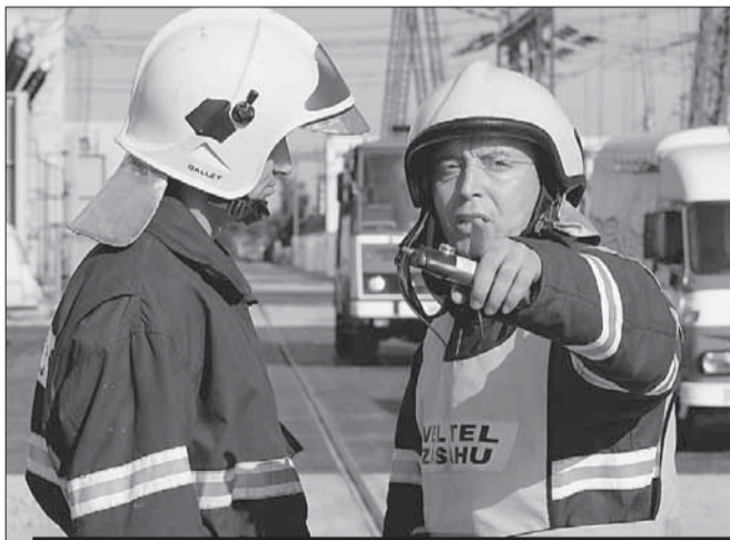
Záchranáři v kraji pravidelně trénují. Naposledy při cvičném požáru v jaderné elektrárně Dukovany.

Vysočina • Pokud by na území kraje došlo k teroristickému útoku, jsou složky krizového řízení připravené. Problém je ale s strojovou kapacitou nemocnic. To jsou nejdůležitější poznatky z rychlé kontroly akceschopnosti krizových štábů na Vysočině, kterou po událostech v Londýně na začátku června nařídil hejtman Miloš Vystrčil (ODS).