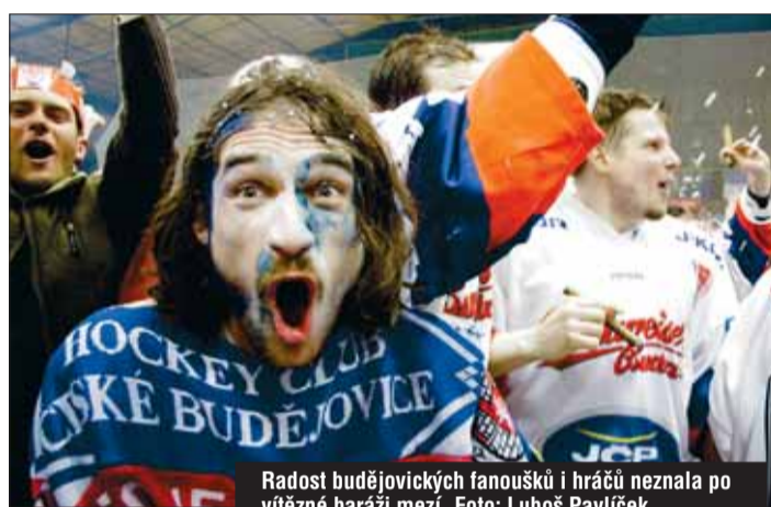
Radost budějovických fanoušků i hráčů neznala po vítězné baráži mezi.