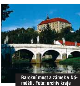
Barokní most a zámek v Námĕšti.

barokních soch mimořádnĕ umĕleckĕ hodnoty.