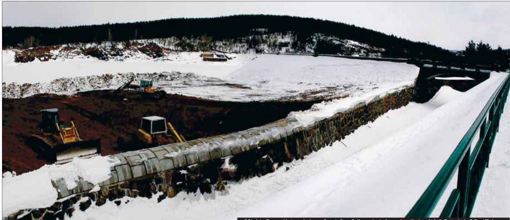
Dělníci připravují otvor do bezpečnostního přelivu, aby hráz neohrozilo jarní tání.

Při nedostatku pitné vody není problém zabezpečit obyvatelstvo ■ Daleko větší nebezpečí hrozí potravinářským provozům