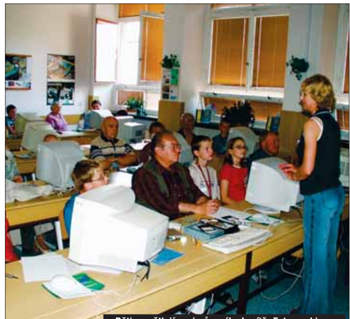
Děti vysvětlují seniorům výhody sítě.

Projekt v Jihlavě zahájila obecně prospěšná společnost Internet pro všední den ve spolupráci s magistrátem a podporou společností Oracle a Oxygen. Senioři se učí pracovat s internetem od dětí ze základních škol. Pro děti je to příležitost, jak prokázat své pedagogické schopnosti, jejich svěření naopak získávají další cestu ke svému okolí. „Pochopitelné bariéry k moderním technologiím u seniorů pomáhají odstranit právě naši dětské koučové, kteří postupně vysvětlují nejen jak internet a elektronické vzdělávání používat, ale také ukazují výhody, které moderní technologie