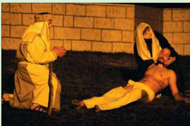
Každoročně se ve Zďáru nad Sázavou koná pašijová hra o posledních dnech Ježíše Krista. Letos ji překazil sníh.

Svátkům podle křesťanské tradice předchází čtyřicetidenní půst, který by měl být přípravou na oslavu Ježíšova zmrtvýchvstání. Velikonoce v podstatě začínají už Zeleným čtvrtkem, tedy dnem poslední večeře a Kristova zatčení. O Velkém pátku pak byl ukřižován a v noci ze soboty na neděli vstal z mrtvých a vstoupil na nebe. V neděli se slaví Boží hod velikonoční, kdy půst končí a o Čer-