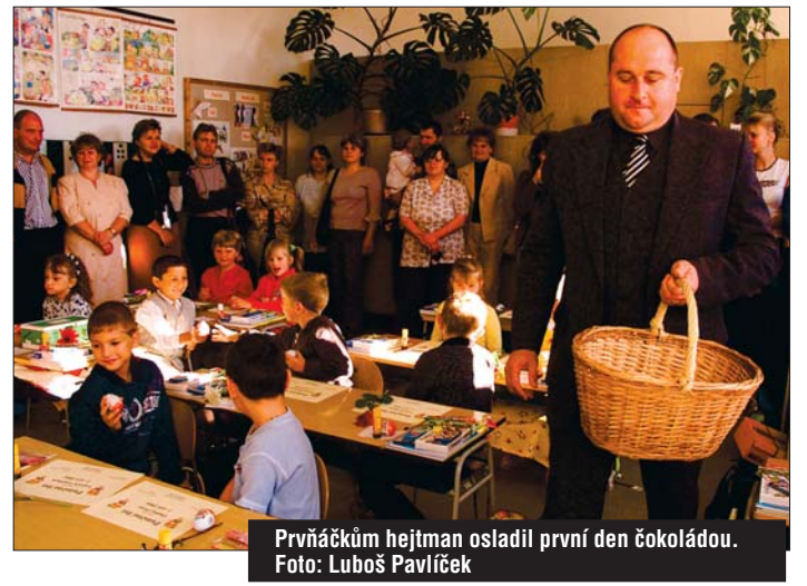
Prvňáčkům hejtmán osladil první den čokoládou.