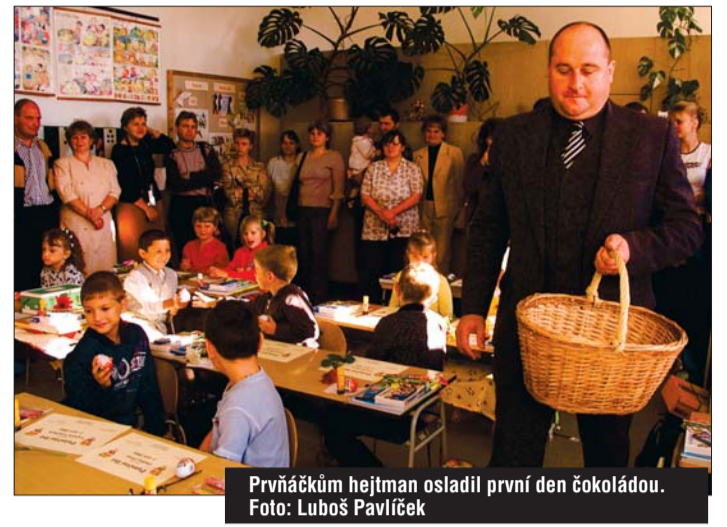
Prvňáčkům hejtman osladil první den čokoládou.

Hejtman přiznal, že i on měl doby žák několik známek. „Zapomínal jsem, ale za to se tenkrát známky nedávaly, většinou jsme vyfasovali něco navíc nebo si to s námi prostě učitelé vyřídili. Pamatuji si na jednoho, který tahal za krátké vlasy nad ušima nebo na krku, ale nic drastického to nebylo. Jednou jsem doma zapomněl úkol z českého jazyka. Měl jsem ho, jenom jsem ho nechal doma. Paní učitelka mi nevěřila, a tak jsem jí ho řekl zpaměti. Měli jsme tehdy vypsat nějaká slangová slova, která používáme doma. Nakonec mi ale uvěřila,“ zavzpomínal Dohnal, který měl podle svých slov rád všechny předměty kromě kreslení.