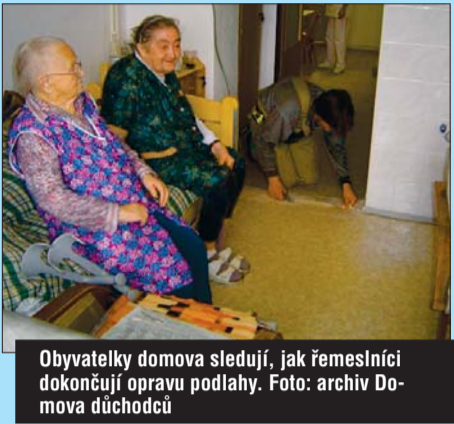
Obyvatelky domova sledují, jak řemeslníci dokončují opravu podlahy.

vebních akcí v sociálních zařízeních Vysočiny a jediná, která směřuje ke zlepšení bydlení. Kraj se doposud zaměřoval na havarijní opravy třeba střech či kuchyní,“ vysvětlila radní pro kulturu, zdravotnictví a sociální věci Martina Matějková (ODS).