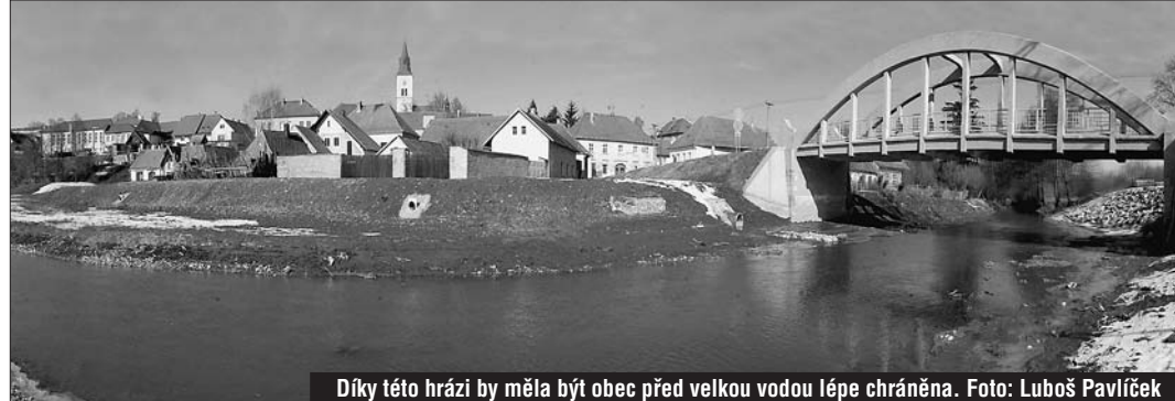
Díky této hrázi by měla být obec před velkou vodou lépe chráněna.

Velká voda před dvěma lety zaplavila 14 usedlostí • S placením prevence pomohl kraj