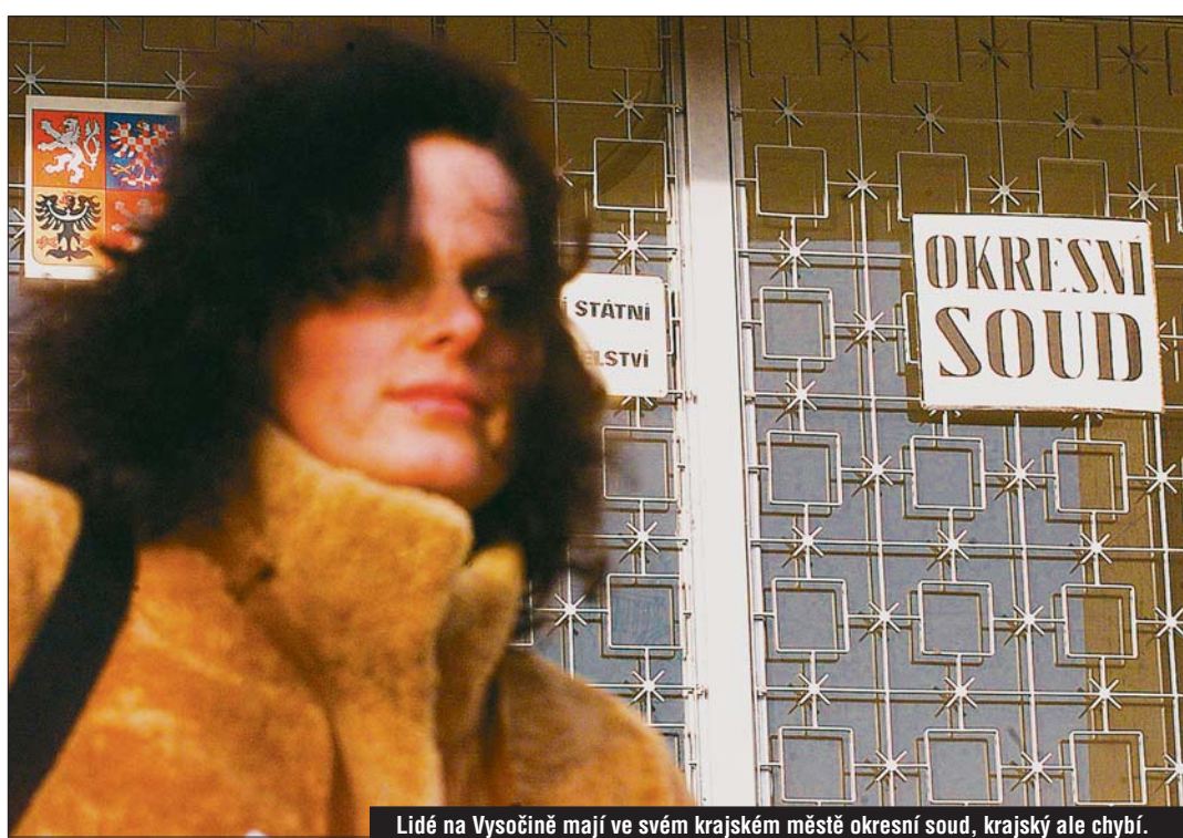
Lidé na Vysočině mají ve svém krajském městě okresní soud, krajský ale chybí.

O blýskání na lepší časy svědčí fakt, že ministerstvo spravedlnosti už začalo v Jihlavě budovat pobočku krajského soudu. Zastupitelé Vysočiny na svém posledním jednání schválili prodej budov v areálu staré nemocnice ministerstvu za symbolickou tisícikorunu. Ani to ale zpočátku nebylo bez problémů. Ministerstvo ve všech nových krajích buduje pobočky krajských soudů, které pak postupně přemě-