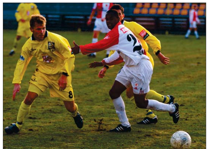
Jihlavští fotbalisté na podzim překvapivě v poháru ČMFS vyřadili z dalších bojů Slavii Praha a zajistili si tak postup do osmifinále. V jeho rámci přivítají 17. března na svém hřišti Viktorii Plzeň.

nový víkend, 2. fotbalová liga, v níž Vysočinu reprezentuje stejnojmenný jihlavský klub, má na programu své první jarní kolo už 7. března.