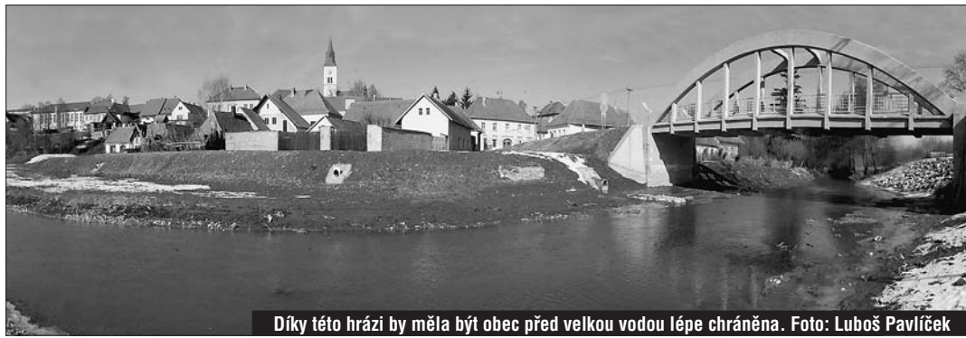
Díky této hrázi by měla být obec před velkou vodou lépe chráněna.

Velká voda před dvěma lety zaplavila 14 usedlostí ♦ S placením prevence pomohl kraj