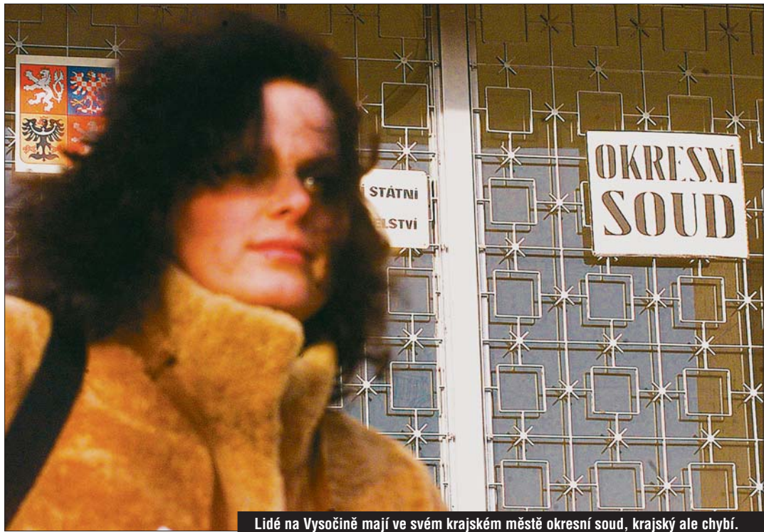
Lidé na Vysočině mají ve svém krajském městě okresní soud, krajský ale chybí.

totiž dnes někdo na Vysočině projednat cokoli na krajské úrovni například s policií, musí do Brna, Hradce Králové a Českých Budějovic. O blýskání na lepší časy svědčí fakt, že ministerstvo spravedlnosti už začalo v Jihlavě budovat pobočku krajského soudu. Zastupitelé Vysočiny na svém posledním jednání schválili prodej budov v areálu staré nemocnice ministerstvu za symbolickou tisícikorunu. Ani to ale zpočátku nebylo bez problémů. Ministerstvo ve všech nových krajích buduje pobočky krajských soudů, které pak postupně přemě-