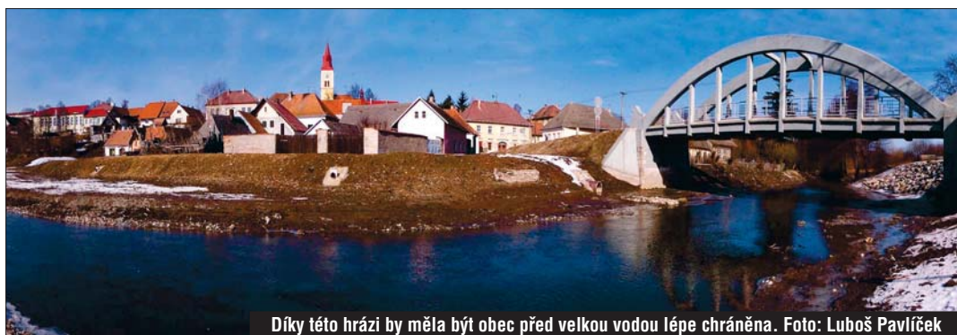
Díky této hrázi by měla být obec před velkou vodou lépe chráněna.

Velká voda před dvěma lety zaplavila 14 usedlostí. S placením prevence pomohl kraj.