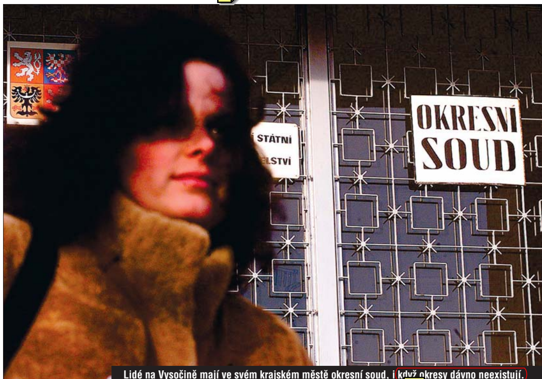
Lidé na Vysočině mají ve svém krajském městě okresní soud, i když okresy dávno neexistují.

O blýskání na lepší časy svědčí fakt, že ministerstvo spravedlnosti už začalo v Jihlavě budovat pobočku krajského soudu. Zastupitelé Vysočiny na svém posledním jednání schválili prodej budov v areálu staré nemocnice ministerstvu za symbolickou tisícikorunu. Ani to ale zpočátku nebylo bez problémů. Ministerstvo ve všech nových krajích buduje pobočky krajských soudů, které pak postupně přemě-