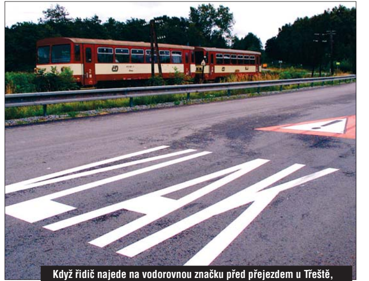
Když řidič najede na vodorovnou značku před přejezdem u Třeště, uslyší hučení pneumatik.

Známý nebezpečný přejezd u Třeště už je těmito bezpečnostními prvky opatřen. Stálo to 120.000 korun. Na Pelhřimovsku do konce září přibude vislé značení a vodorovné pruhy na přejezdu u Leskovic, na Třebíčsku poblíž obce Červená Hospoda a na Žďársku v Rožně. „Celkem nás zkušební zabezpečení přejezdů přijde na více než 650 tisíc korun,“ řekl Petr Pospíchal.