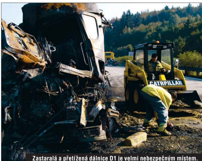
Zastaralá a přetížená dálnice D1 je velmi nebezpečným místem. Na podzim zde shořely hned tři kamiony.

Přes tyto drobnosti ale cvičení Horizont 2004 prokázalo, že se kraj o své obyvatele dokáže rychle a účinně postarat. „Jaderná elektrárna Dukovany představuje v kraji pouze papírové riziko. Daleko reálnější je předpoklad kolapsu například na dálnici D1, s havárií, která ohrožuje životní prostředí. Nemusíme chodit daleko, nedávne