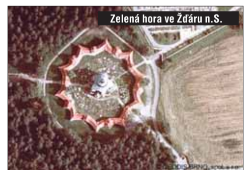
Zelená hora ve Zdráru n.S.