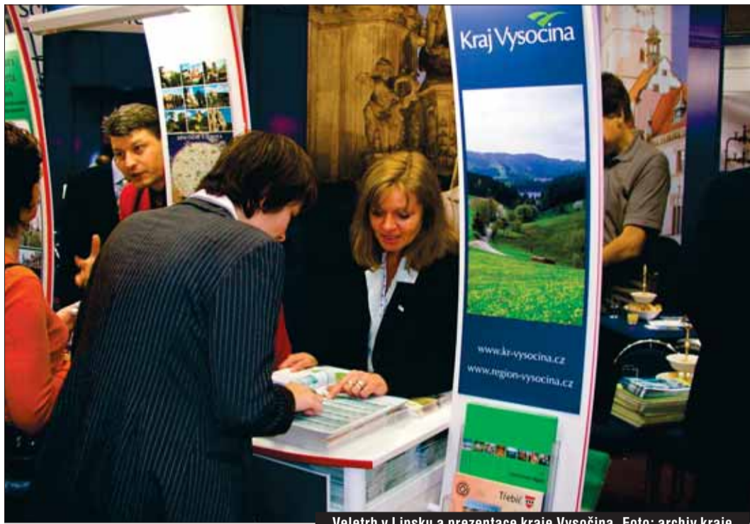
Veletrh v Lipsku a prezentace kraje Vysočina.