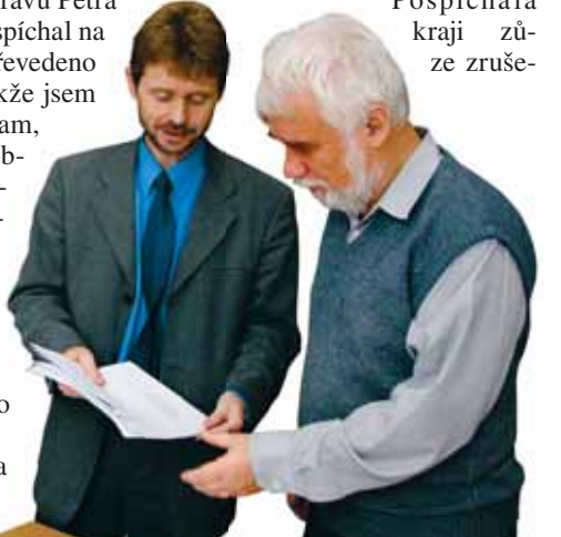
To je můj rozvrh hodin, pane řediteli? Miloš Vystrčil se chystá mezi studenty.

Cesta do krajské rady vedla u Miloše Vystrčila přes telčskou starostovskou židli. Ještě předtím ale učil na místním gymnáziu a tak je nyní k máni zase mezi studenty: „Supluji za chybějící profesory, byl jsem také v hodinách společenskovedního semináře a společenské výchovy, kde jsem přednášel o fungování samospráv, hlavně samosprávy krajské. Učím fyziku, možná budu suplovat i matematiku. Zítřka mne čeká například výuka proměnného magnetického pole, magnetický indukční tok a věci s tím spojené a velmi se na to těším, protože mezi dětmi je hezky,“ řekl Kraji Vysočina Miloš Vystrčil v rychlosti na chodbě.