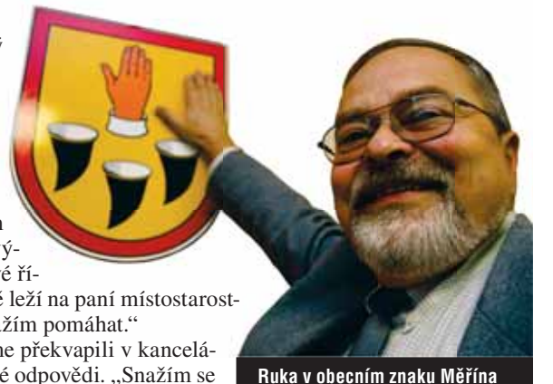
Ruka v obecním znaku Měřína znamená hrdelní právo. Pro starostu Rohovského prý ale neplatí.