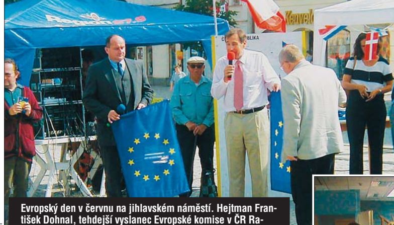
Evropský den v červnu na jihlavském náměstí. Hejtmán František Dohnal, tehdejší vyslanec Evropské komise v ČR Ramiro Cibrian a jihlavský primátor vysvětlovali před referendem, co vstup do Evropy pro obyvatele Vysočiny znamená.