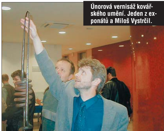
Únorová vernisáž kovářského umění. Jeden z exponátů a Miloš Vystrčil.