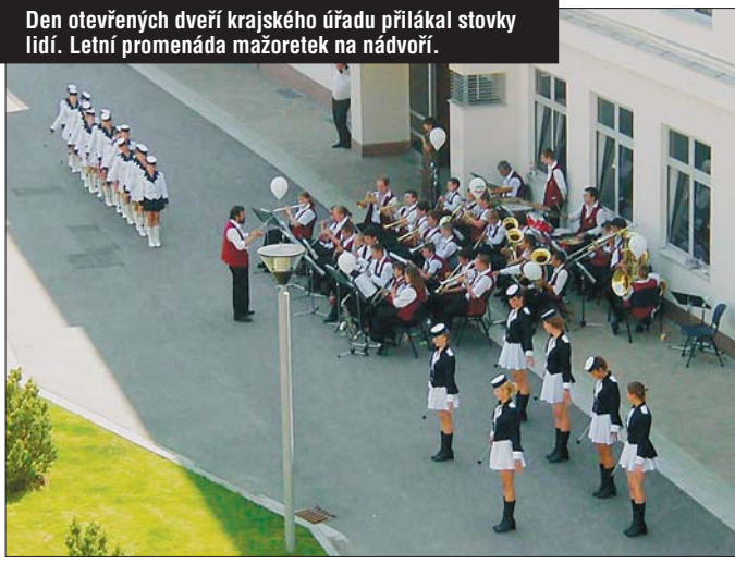
Den otevřených dveří krajského úřadu přilákal stovky lidí. Letní promenáda mažoretek na nádvoří.