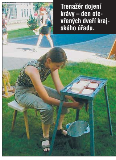
Trenažér dojení krávy – den otevřených dveří krajského úřadu.