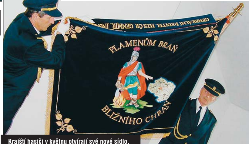
Krajští hasiči v květnu otvírají své nové sídlo.