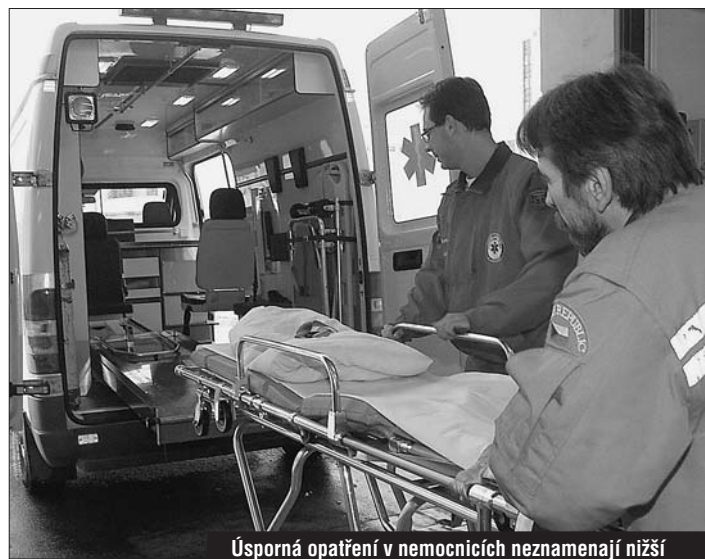
Úsporná opatření v nemocnicích neznamenají nižší kvalitu péče.