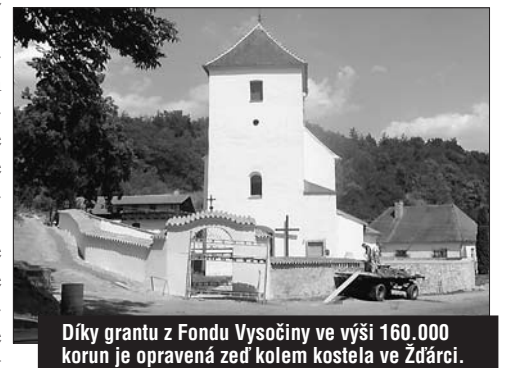
Díky grantu z Fondu Vysočiny ve výši 160.000 korun je opravená zeď kolem kostela ve Žďárci.

evropské dotace a žadatel mohl prostředky kraje a Evropy spojit: „Je to ovšem spíš námět pro letošní celoroční debatu.“