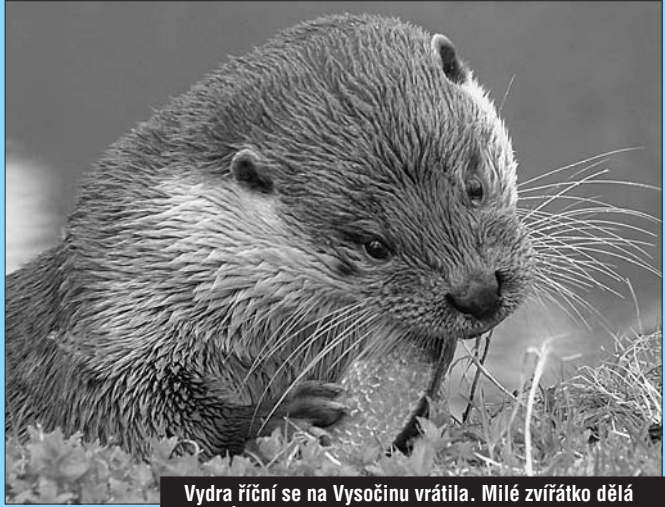
Vydra říční se na Vysočinu vrací. Milé zvířátko dělá rybářům krásy.

Náhrada se nevztahuje na řeky, kde škodu nelze vyčíslit. Krajský úřad loni povolil rybářům odstřel kormorána na řece Oslavě, a to až do konce roku 2005.