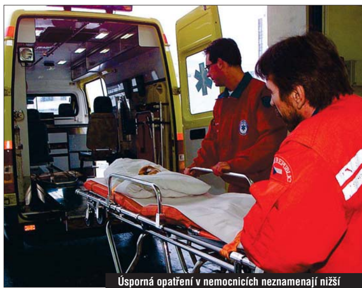
Úsporná opatření v nemocnicích neznamenají nižší kvalitu péče.