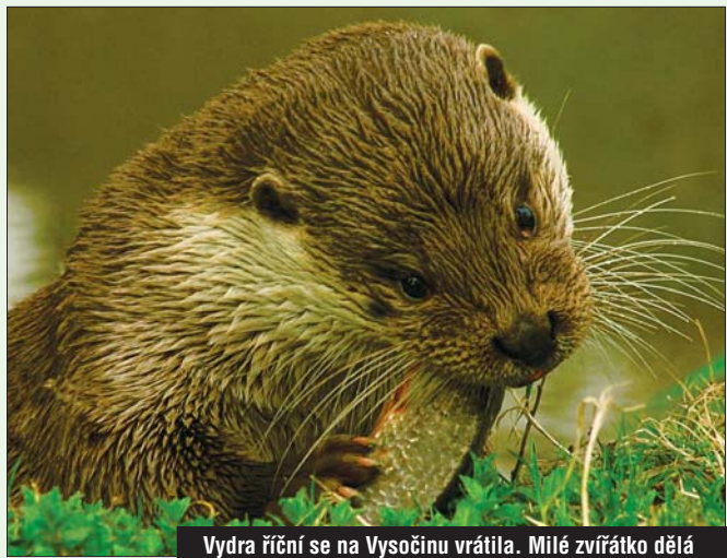
Vydra říční se na Vysočinu vrací. Milé zvířátko dělá rybářům vrásky.

Náhrada se nevztahuje na řeky, kde škodu nelze vyčíslit. Krajský úřad loni povolil rybářům odstřel kormorána na řece Oslavě, a to až do konce roku 2005.