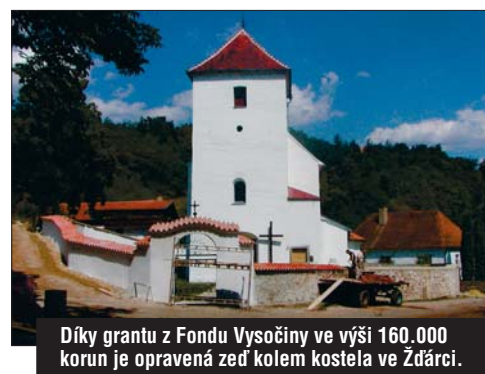
Díky grantu z Fondu Vysočiny ve výši 160.000 korun je opravená zeď kolem kostela ve Žďárci.

evropské dotace a žadatel mohl prostředky kraje a Evropy spojit: „Je to ovšem spíš námět pro letošní celoroční debatu.“